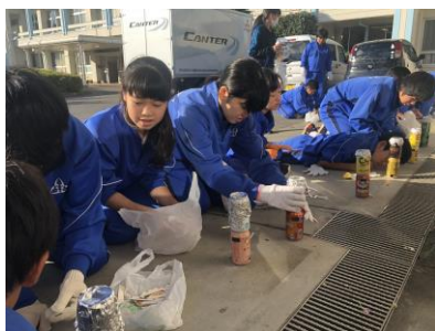
1年・サバメシコース

生徒は震災の体験を踏まえ、真剣な表情で取り組みました。みんなで助け合うことの大切さについて考え、生徒一人一人の防災・減災についての意識が高まった活動となりました。