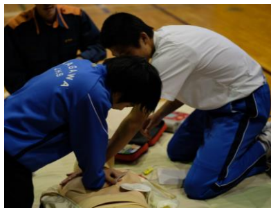
2年・救急救命コース